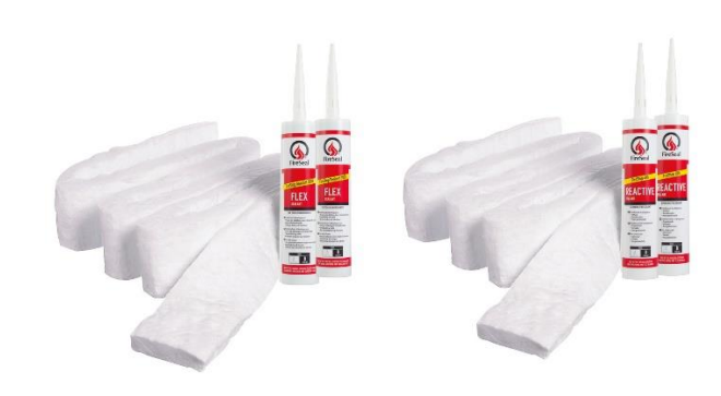
Fig.1 Flex Blanket System og Reactive Blanket System.

tilhørende RISE Fire Research AS produktdokumentasjon RISEFR AA-032". Tabellene angir maks. dimensjoner på utsparingen. I gipsvegger må en ramme monteres rundt gjennomføringstettingene Flex Blanket System og Reactive Blanket System.