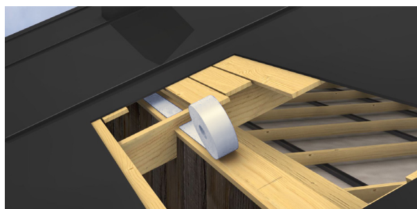
Rulla ut brandstoppet mellan takstolarna.