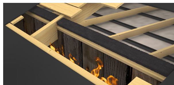
Monterat och klart. Brandtätningen expanderar kraftigt redan vid låga temperaturer